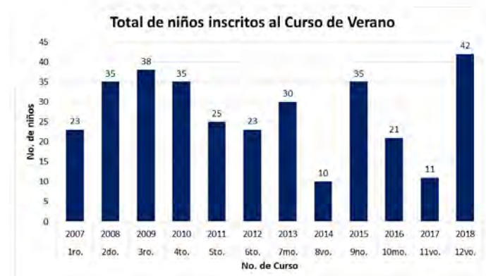
Gráfica 1. Total de niños inscritos en los doce cursos (Programa Ambiental Universitario-Unicach)

El Curso de Verano ha mantenido un interés creciente, y cada vez con mayor demanda, destacando algunos niños que han asistido a cuatro de los doce cursos.